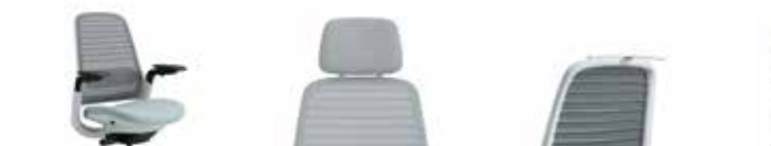
Armlehnen (1D, 4D, ohne)