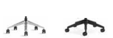
Gestell Aluminium Poliert