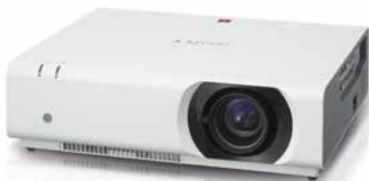
VPL-CH350, VPL-CH355 und VPL-CH375

Bei der Ausstattung mittelgroßer bis großer Unterrichts- oder Konferenzräume kommt es auf die Kosten an. Der VPL-CH350, VPL-CH355 und VPL-CH375 sind eine kostengünstige Wahl ohne Abstriche bei der Bildqualität.