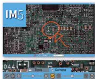
Image Mate 5