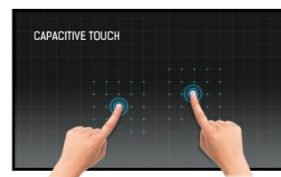
Touch Technologie - Kapazitiv

Dank des Android-Betriebssystems können Applikationen einfach installiert werden und der Bildschirm ganz flexibel Ihren Bedürfnissen angepasst werden.