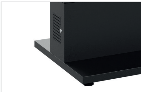
Lüftungsöffnungen sorgen für effektive Wärmeabfuhr

Durch Zusatzoptionen lässt sich die Stele zudem für den gewünschten Einsatzort individuell anpassen.