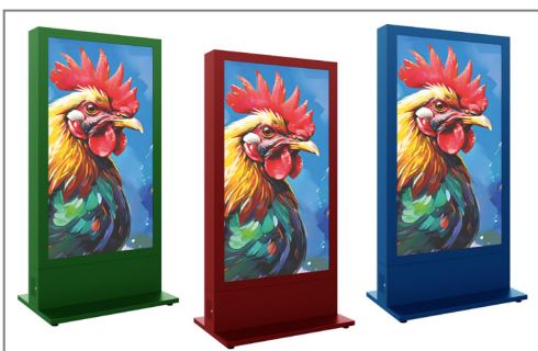
Optional auch in einem RAL-Ton nach Wunsch