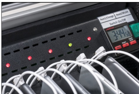
- LED Ladeanzeige