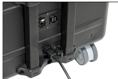
- Sync- und Netzwerk Anschluss