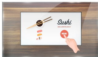
Touch durch Glas

Der Open-Frame ProLite TF1015MC verwendet die PCAP-Touch-Technologie und ist verbaut in einem formschönen Edge-to-Edge Glas Design. Dank seiner Glasauflage und dem robusten Rahmen garantiert der Bildschirm eine hohe Haltbarkeit und Kratzfestigkeit und ist somit ideal für Kiosksysteme und Anwendungen im öffentlichen Einsatz geeignet. Die IPS-Panel-Technologie bietet eine präzise und konsistente Farbwiedergabe mit weiten Betrachtungswinkeln. Ausgestattet mit einer Schaumstoffdichtung bietet das Gerät eine nahtlose Integration in Kiosksysteme. Mit der IP65 Zertifizierung bietet das Gerät eine Staub- und Wasserresistenz in der Bedienung. Die Ausrichtungsoptionen Quer- und Hochformat sorgen für flexible Montagemöglichkeiten. Der TF1015MC kann mit separat erhältlichen Befestigungswinkeln ausgestattet werden ( OMK2-1 ), die den Einbau erleichtern. Die ideale Lösung für Kiosksysteme, industrielle Umgebungen, Kontrollräume und interaktive Multimedia-Anwendungen.