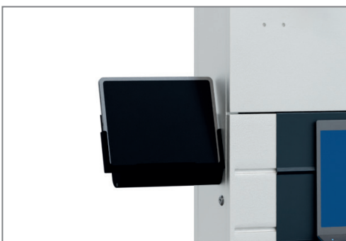
Montage erfolgt seitlich an den Medienstelen