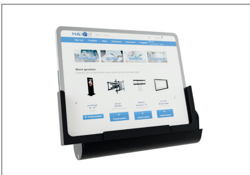
Umlaufende Stützkanten sichern das Tablet