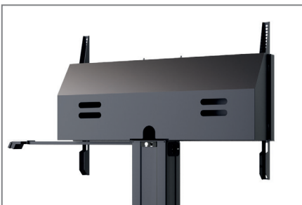
optional: abschließbare Rückabdeckung