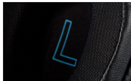
YH-G01: Komfortables Mesh für lange Sessions