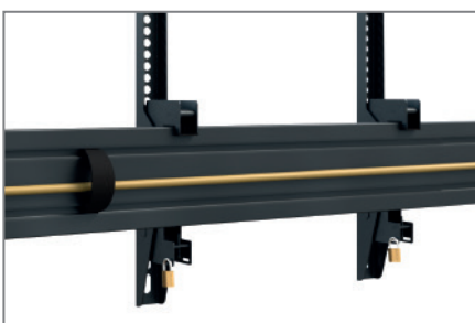
Kabelmanagement mittels Kabelclips