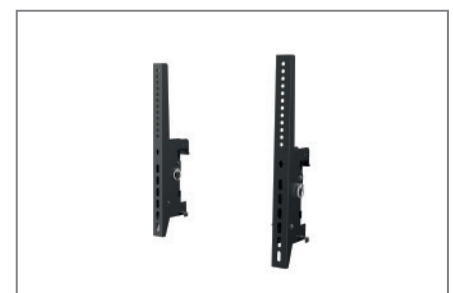
VESA max. 600 x 400 mm