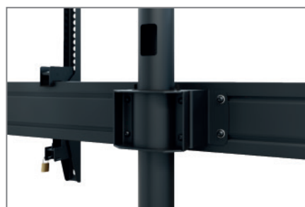
Anpassbar dank modularer Bauweise