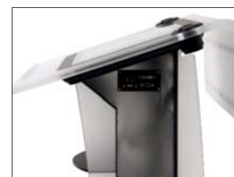
Beispiel Anbringung Anschlussplatine