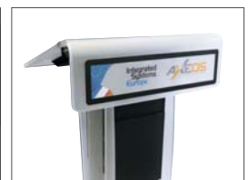
Magnetische Tafel, individuell gestaltbar