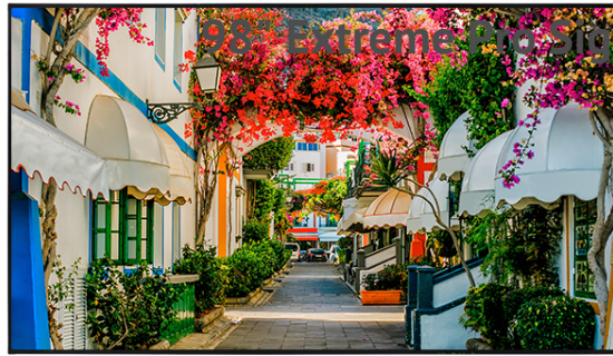
Extreme Thin Signage Displays