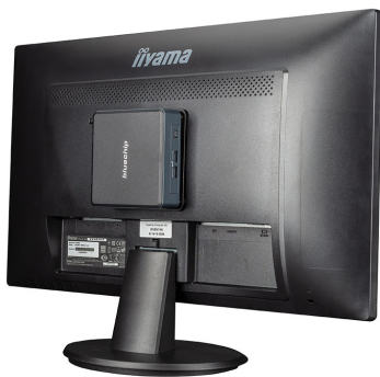
Monitor nicht im Lieferumfang