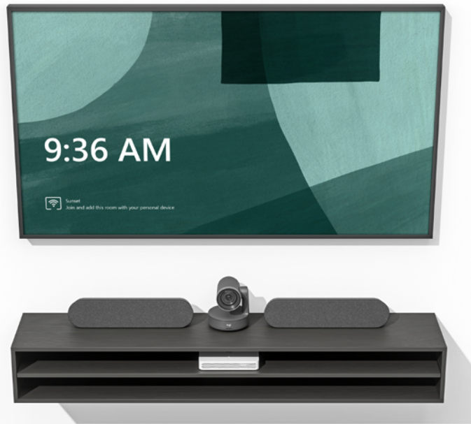
Logitech RoomMate con sistema Rally Plus