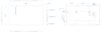
Philips 86BDL6051C Version 2.1 Revised Date