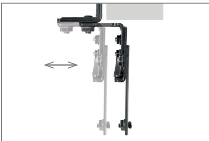
Die Tiefe ist variabel anpassbar