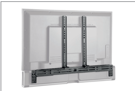
Wahlweise oberhalb oder unterhalb des Bildschirms montierbar