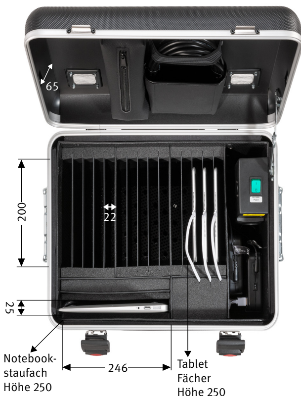
Abmessungen innen in mm