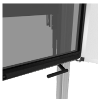
Griff zur Bedienung man.Pylonen- anlage