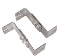
2 verzinkte verstellbare Wandhalterungen