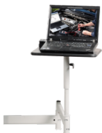
Schwenkarm für Notebooks