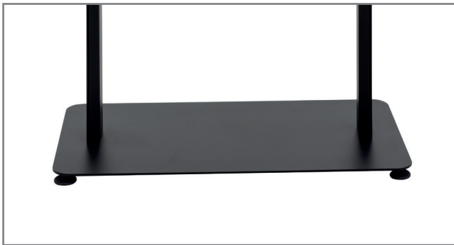
Kippsicherer Standfuß für flexible Positionierung im Raum

Alternativ steht auch eine Variante zur direkten Bodenmontage zur Verfügung. Floormount OM46N-D (Art.-Nr.: 1917)