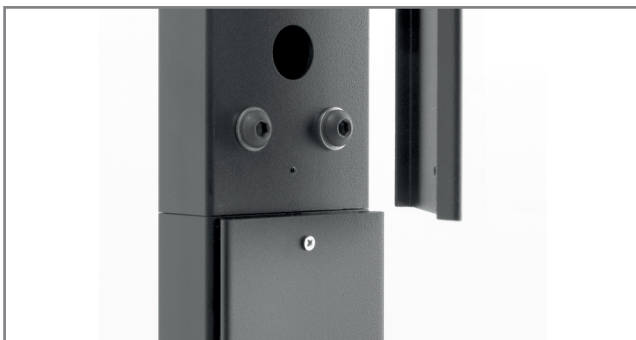
Kabelführung innerhalb des Rahmens und der Tragsäulen