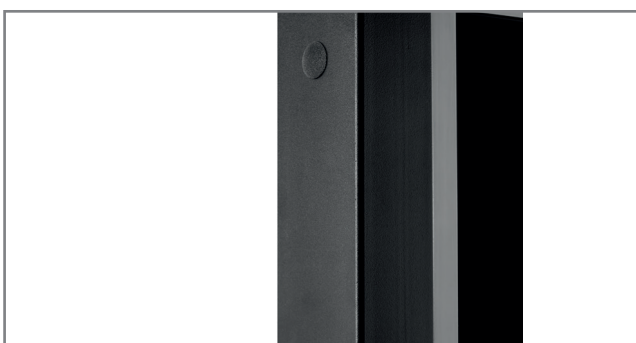
schlag- und kratz-feste Pulverbeschichtung